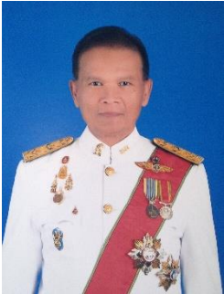
ศ.เกียรติคุณ ดร.ธรรมศักดิ์ พงศ์พิชญาматы